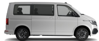
VW T6 Multivan

Ob mit Schaltung oder Automatik - wir helfen euch dabei, euch sicher im Straßenverkehr fortzubewegen. Mit unserem modernen Fuhrpark (auch Elektro) garantieren wir dabei Fahrspaß pur.