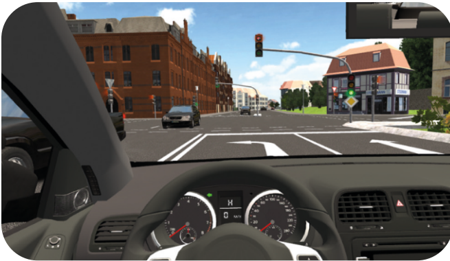
Simulator 360°simdrive III - immer neueste Generation

Unsere Fahrsimulatoren für PKW, Bus und LKW der neuesten Generation bereiten dich ganz ohne Stress und Angst auf die ersten Fahrstunden vor. Hier kannst du das Anfahren, Schalten und Lenken trainieren, bevor es auf die Straße geht. Das schont nicht nur Nerven, sondern macht auch noch Spaß.